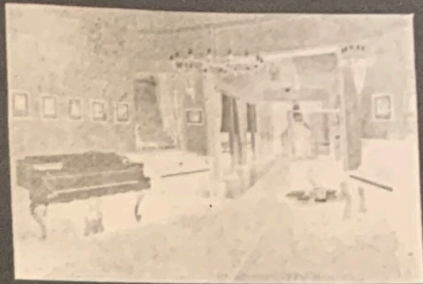
VERKAUFSRÄUME: EMPFANGSRAUM UND MUSIKALIEN-ABT