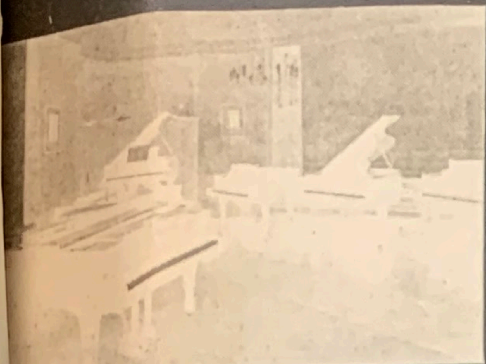
VERKAUFSRÄUME: TEILANSICHT DES FLÜGELSALES